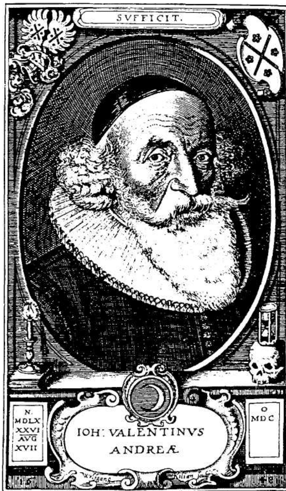
Retrato de Andreae hecho por Kilian en 1648. Arriba, a ambos lados, la cruz de San Andrés y las cuatro rosas, emblema del escudo familiar