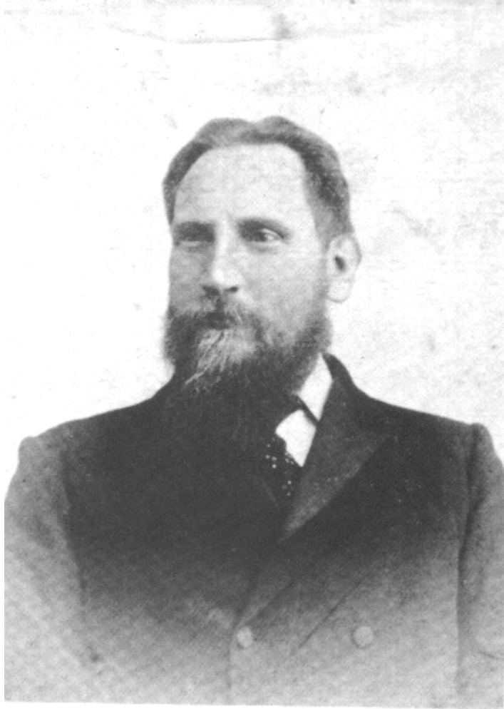
Fotografía de Leadbeater