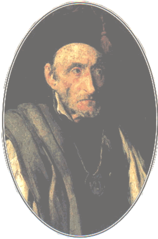
Pintura de Cagliostro