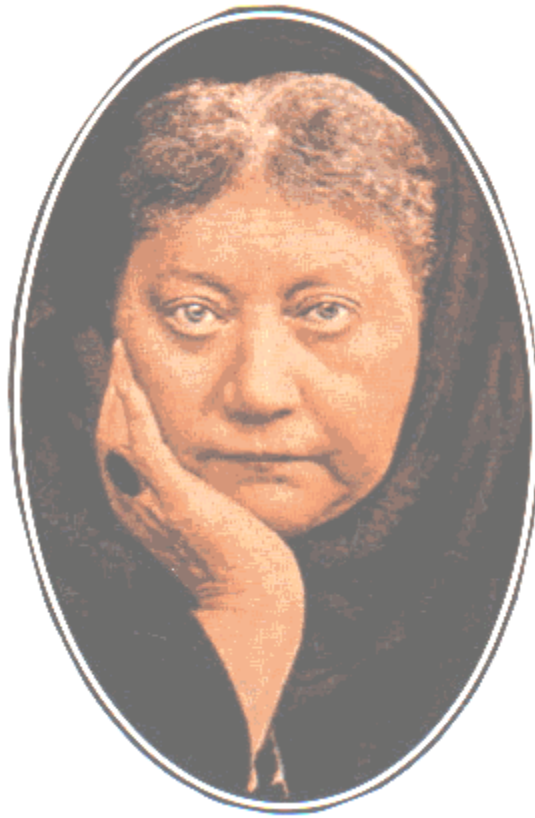
Fotografía de Blavatsky