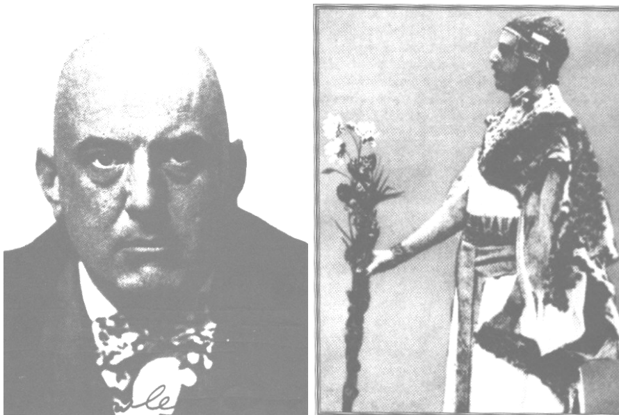
Aleister Crowley y Mathers

Aleister Crowley , afamado por sus practicas de magia negra fue iniciado en 1898 y rápidamente entro en conflicto con los fundadores, termino siendo expulsado de la Orden por sus practicas, razón por la cual se vengo publicando los rituales del Amanecer Dorado en la revista publicada por el mismo y llamada "The Equinox" (El Equinoccio). Mathers que anteriormente había puesto a Aleister Crowley como jefe máximo de la Orden en Inglaterra se enojo por la expulsión de Crowley y declaro que Wescott había falsificado el manuscrito que daba fundamento a la Orden, lo que llevo al rompimiento de la misma en pequeños grupos descendientes de ella.